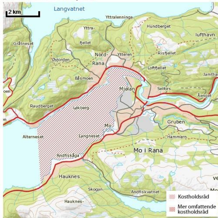
Kostholdsråd for Ranfjorden